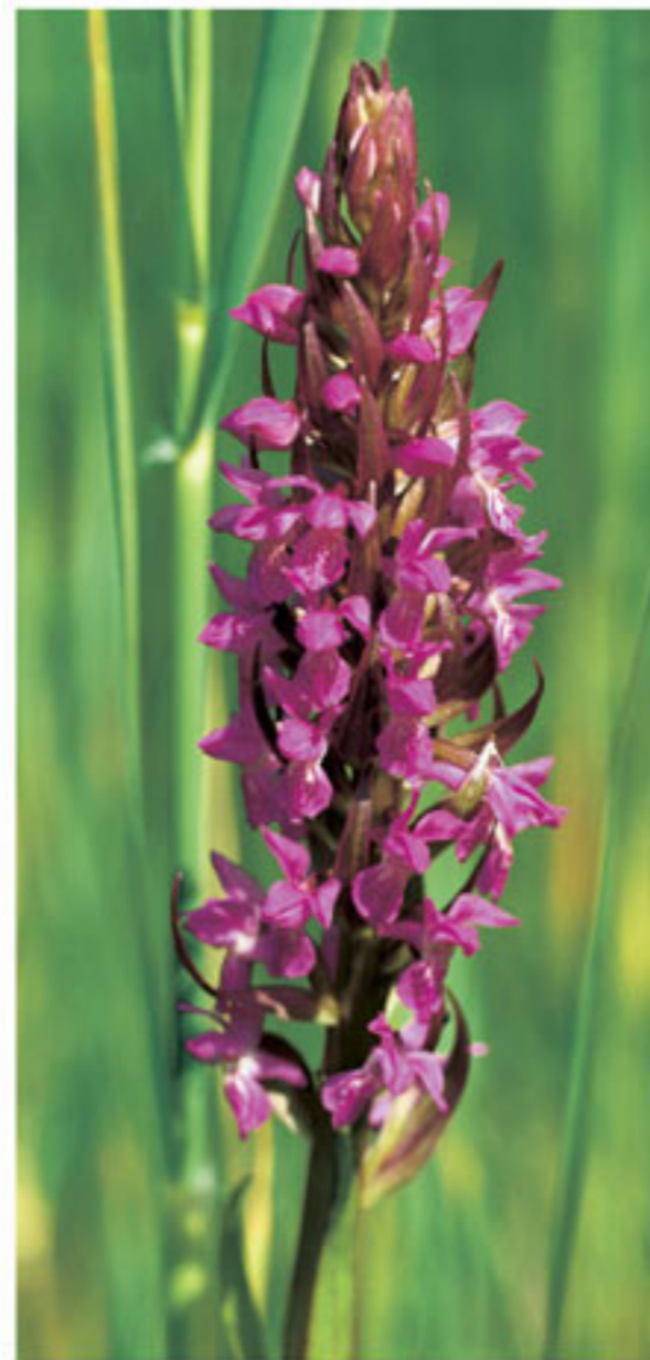
Fleischrotes Knabenkraut - Orchidea palmata

↑ Der Grasfrosch beginnt schon im März mit der Laichablage. ↑ La rana montana compare all'inizio di marzo nelle acque e vi depono le uova.