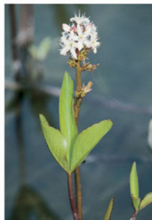
Fieberklee - Trifoglio fibrino

× Lage: Gemeinde Margreid an der Weinstraße; 1033 m Meereshöhe × Größe: 10 ha, Wasserfläche 1.3 ha × Entstehung: Der eiszeitliche Etschgletscher hat das Becken des Fennberger Sees ausgeräumt und mit einer wasserundurchlässigen Gletschertonschicht ausgekleidet. × Vegetation: Seebinsen-Schilfgürtel am Ufer, Großseggenried, Pfeifengraswiesen. × Bedeutung: Der See, sein Schilfgürtel, die Feuchtwiesen sowie der Seebach sind wichtige und vielfältige Lebensräume für zahlreiche, teilweise bedrohte Tier- und Pflanzenarten. × Schutz: seit 1977