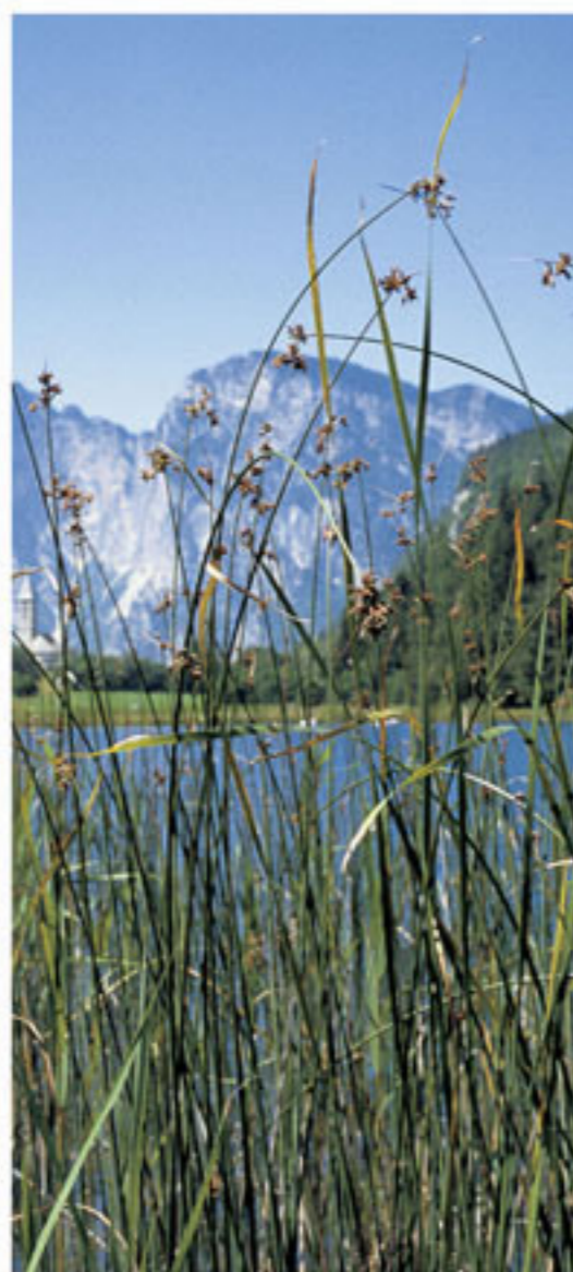
Seebinsse - Lissa lacustris

→ Die Ufervegetation spielt für die Erhaltung der Wasserqualität eine entscheidende Rolle; wichtige Prozesse der biologischen Selbstreinigung finden hier statt, so werden Nährstoffe abgebaut, Sedimente zurückgehalten und Sauerstoff angereichert. → La vegetazione che cresce sulle rive gioca un ruolo determinante per il mantenimento della qualità delle acque; si verificano qui importanti processi di autodepurazione biologica, vengono decomposte sostanze nutritive, trattenuti sedimenti e l'acqua si arricchisce di ossigeno.