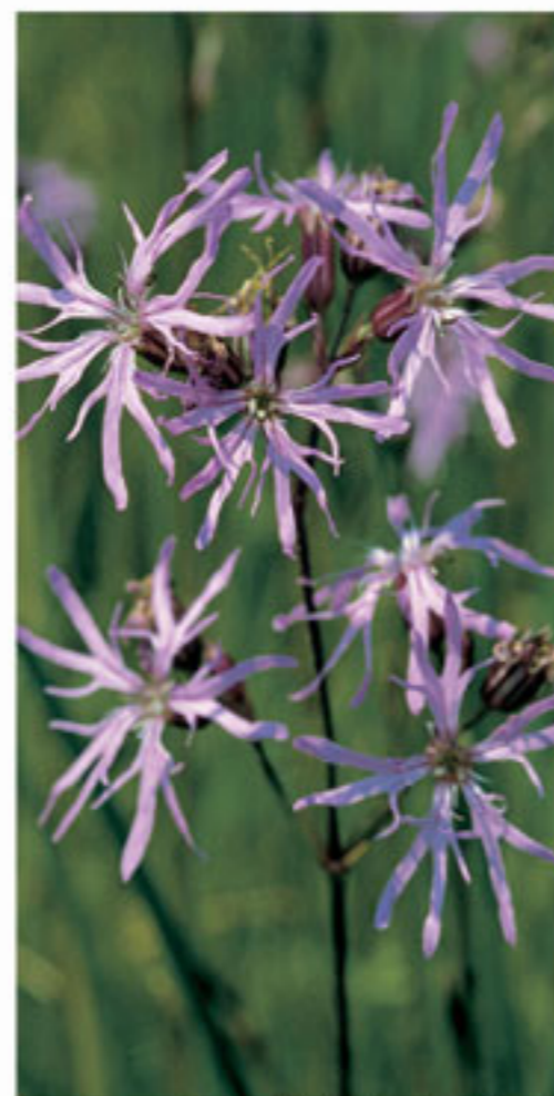
Kuckuckslichtnelke - Fior di cuculo